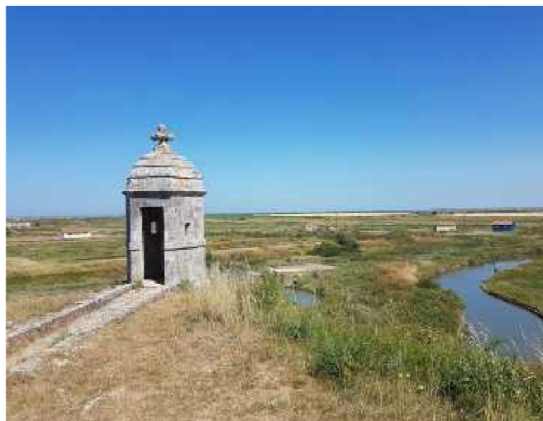
Le marais de Brouage, un site d'exception. S. G.

En complément, les élus communautaires ont voté, mercredi 6 avril, la mise en place d'une convention pour la réalisation d'une étude de la fréquentation sur le marais de Brouage. Cette étude, commandée par la CCBM et la Communauté d'agglomération de Rochefort Océan, permettra de disposer d'une meilleure connaissance qualitative et quantitative de la fréquentation dans la diversité de ses composantes actuelles, à l'échelle du marais. Les deux Communautés collaborent aussi avec le laboratoire Cribham (Centre de recherche interdisciplinaire en histoire, his-