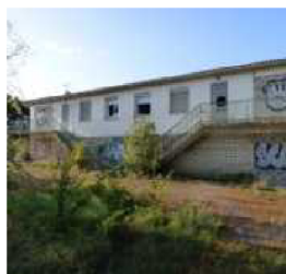
La maison du Martrou sera bientôt réhabilitée. F. D.

Par ailleurs, lors du conseil du 16 mars, les élus avaient autorisé la signature de baux de location en tant que preneur avec la société Pimalimmo et, en tant que bailleur, avec des professionnels de santé afin d'aider à leur installation sur la commune, concernant un immeuble situé dans la zone de Pimale d'une superficie totale de 232 m 2 comprenant