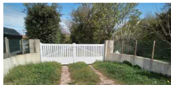
Le lotissement donnerait rue Rigault-de-Genouilly et chemin de la Vache et s'étendrait dans les jardins à l'arrière. J.-L. R.

Le quartier déjà très urbanisé, mais encore vert, aurait une autre allure. « On n'est pas contre des constructions ; lorsqu'on a acheté, on savait que ces terrains seraient bâtis mais là, c'est énorme ; on construit trop. » Et d'ajouter des arguments techniques. « Notre débit d'eau est déjà faible, l'équipement électrique du secteur obsolète ; avec les nouveaux habitants, ce sera catastrophique. Sans compter les places