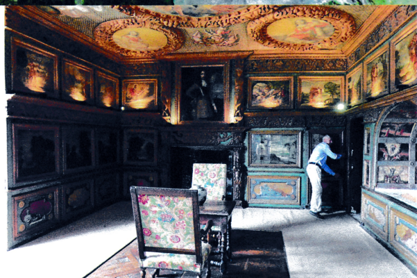
Ci-dessus : la salle des jeux anciens et le cabinet des peintures