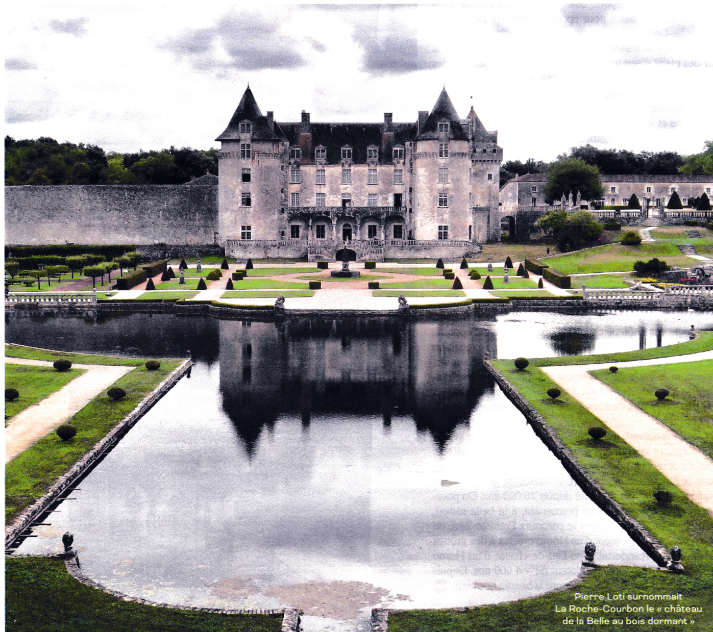
Pierre Loti surnommait La Roche-Courbon le « château de la Belle au bois dormant »