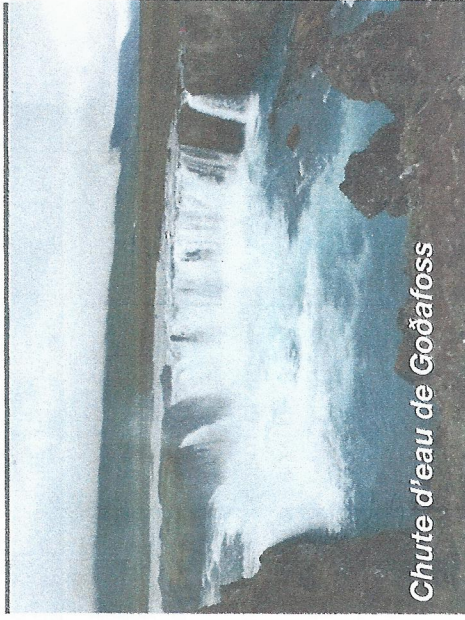
Chute d'eau de Goðafoss