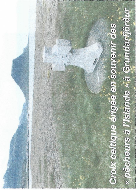
Croix celtique érigée en souvenir des « pêcheurs à l'Islande » à Grundarfjörður

au pays de Paimpol du 13 au 16 juillet 2017