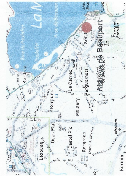
Abbaye de Beauport